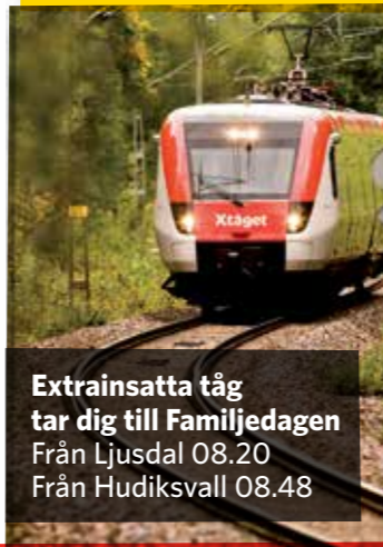
Extrainsatta tåg tar dig till Familjedagen Från Ljusdal 08.20 Från Hudiksvall 08.48