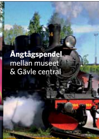
Ångtågspendel mellan museet & Gävle central