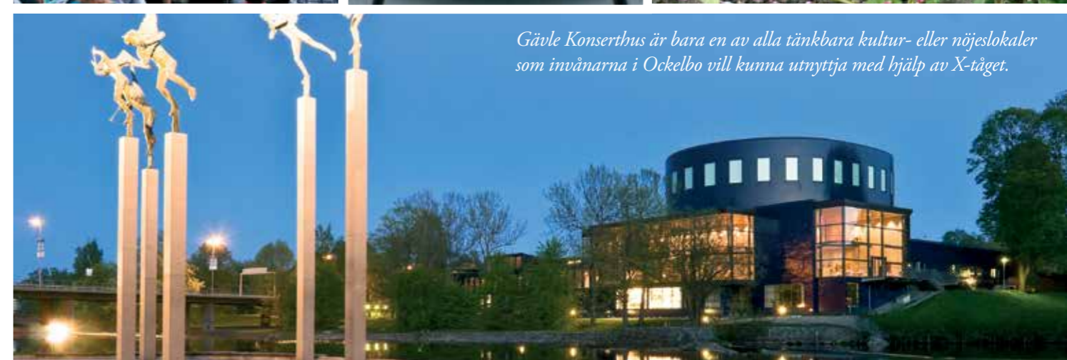
Gävle Konserthus är bara en av alla tänkbara kultur- eller nöjeslokaler som invånarna i Ockelbo vill kunna utnyttja med hjälp av X-tåget.