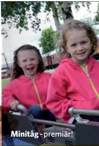
Minitåg - premiär!