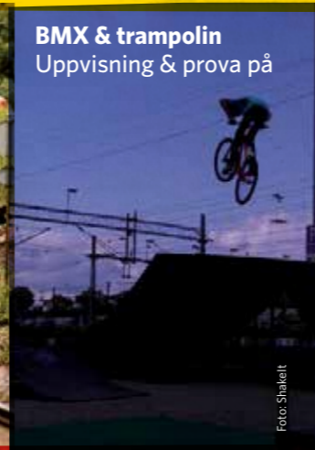
BMX & trampolin Uppvisning & prova på