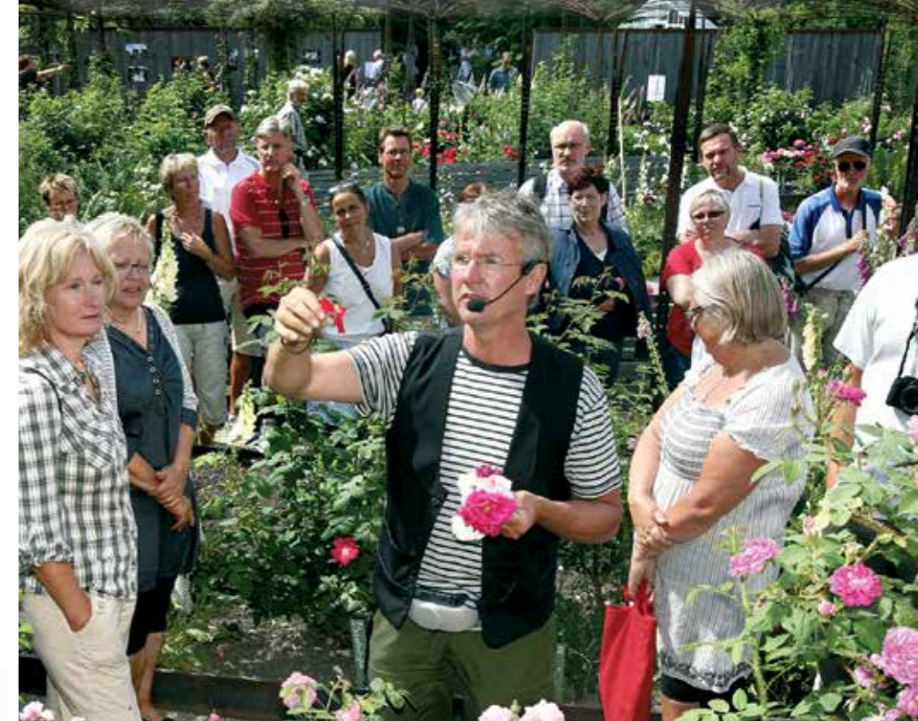
Wij Trädgårdar ligger på bekvämt promenadaavstånd från stationen i Ockelbo via Hälsans stig. Som gjort för en utflykt med X-tåget från Gävle eller Hälsingland.

– Absolut! Det skulle underlätta för dem att rekrytera personal.